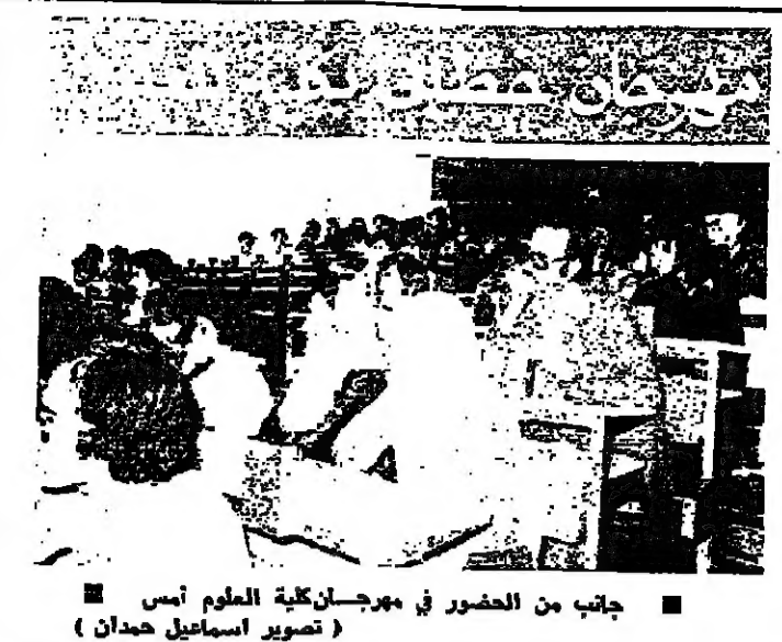
جانب من الحضور في مهرجان كلية العلوم أمس

ويضيف المسؤولون: القرارات التي يتخذها مجلس بلدية بيروت لا تلحق طريقها الى حيز التنفيذ، واحداً على سبيل المثال يحمل الرقم ٥٧٤، يتعلق بتعيين أساليب الجمع ووسائل العمل، واندخال الآليات لتسهيل الجمع والنقل، وزيادة عدد الاجراء وتدويرهم والاقتناء بملابسهم، لكن القرار لا يزال حبراً على ورق.